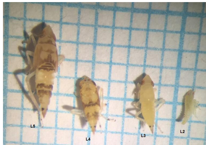
Slika 1. Stadiji razvoja ličinke američkog cvrčka (L2,L3,L4,L5)