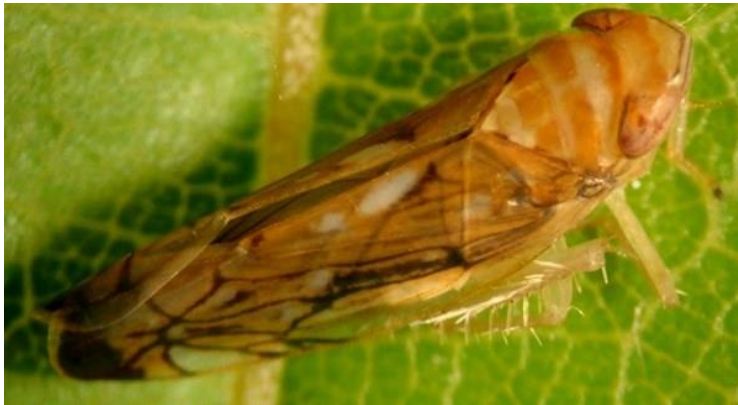
Slika 1. Odrasli oblik američkog cvrčka